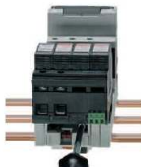
Untere Tragschiene von unten fixieren.