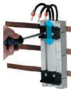
Obere Tragschiene positionieren und von vorne fixieren.